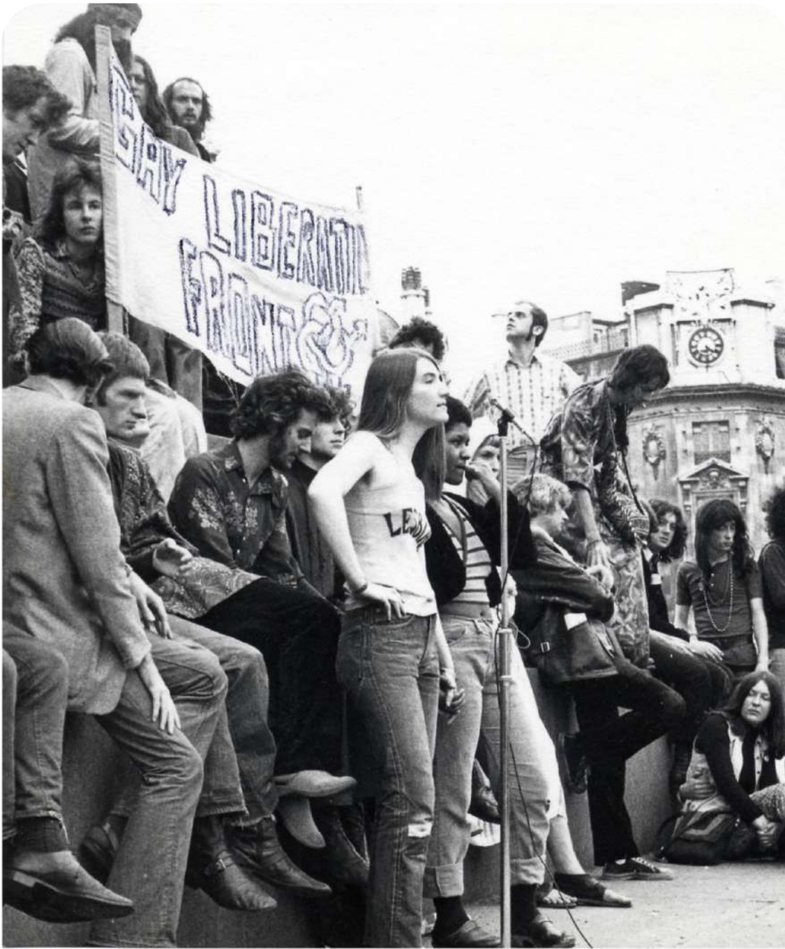
Demonstration för homosexuellas rättigheter på Trafalger Square i London 1972. Från LSE Library Public domain.